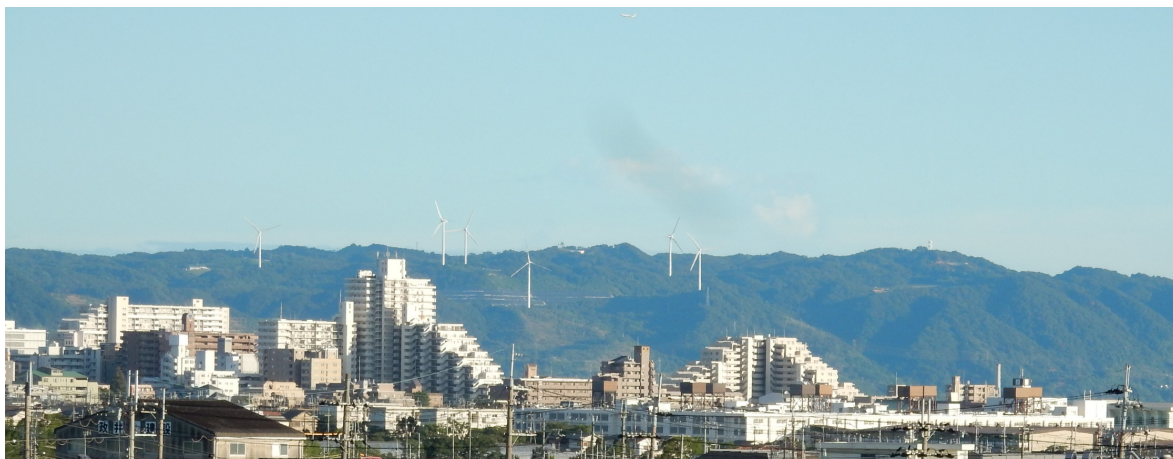
西明石のマンション越しに見える淡路風力発電所の風車群